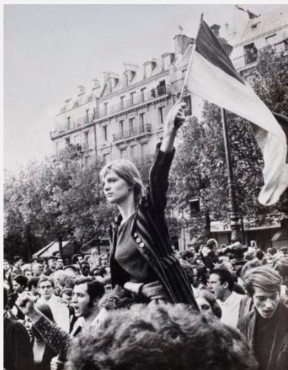
La Marianne de Mai 68

Pour finir sur une note de Curiosité et Inspiration