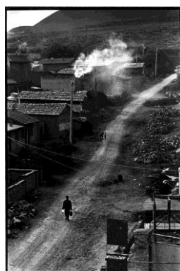
Prix mentions spéciales du jury ex aequo L'homme aux sacs noir et blanc Gaël Brasseur