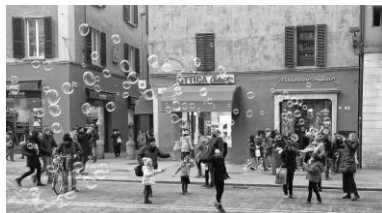
1er prix Effervescence de la rue Dorothee Cary