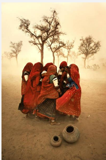
Tormenta de arena