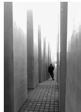
Coup de cœur du public Fuir l'oppression Magali Sansonetti

Félicitations à Magali et Marie-Agnès pour ces belles photos, chacune gagne une dotation de 200 € à valoir sur du matériel photo. Et merci à tous les participants.